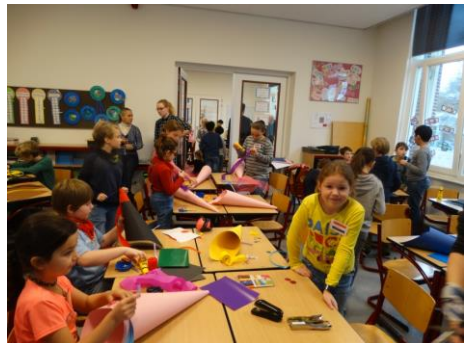
Knutselen van de hoeden en schilden