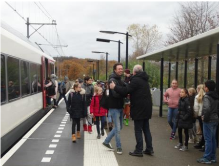
9.39u aankomst trein station de Kissel

We zijn de Duitse kinderen en leerkrachten eerst bij station de Kissel gaan ophalen. Daarna hebben we samen jonkvrouwhoeden en schilden geknutseld, dit was een vervolg op ons bezoek aan Kasteel Hoensbroek van afgelopen juni. We hebben verder samen gegymd, we hebben vossenjacht en gevangenisbal gedaan. Tijdens de lunch hebben we de Duitse kinderen kennis laten maken met typische Nederlandse snoep o.a. taai taai, pepernoten en drop. Na de lunch hebben we samen gezelschapsspellen in groepjes gedaan. We hebben samen gesjoeld en memory in het Nederlands-Duits gedaan. Het was een fijne dag en echt super om te zien hoe makkelijk de kinderen met elkaar samenwerken en communiceren. Wij verheugen al op ons bezoek aan Am Höfling in het voorjaar, dan bezoekt groep 6/7 de Duitse school in Aachen.